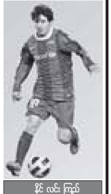
အင်တာနက်၊ နိုင်လင်း ကြည်

ဘာစီလိုနာအသင်း အနေဖြင့် အာဂျင်တီးနားကတားသမား မက်ဆီကို အားကိုးအားထားပြုရခြင်းမှာ မက်ဆီသည် ၂၀၁၁ ကမ္ဘာ့အကောင်းဆုံးဘောလုံးသမားဆုကို ရရှိထားသူဖြစ်ပြီး ၎င်း၏ ဘောလုံးစွမ်းရည်ပြည့်ဝမှုနှင့် အတူ ၂၀၁၀-၂၀၁၂ ၏ ခွဲစိတ်ဆုဆန်ခါတင်စာရင်းတွင်လည်း အဆင့်(၃)နေရာတွင် ရပ်တည်ခဲ့ခြင်းတို့ကြောင့် ဖြစ်သည်။