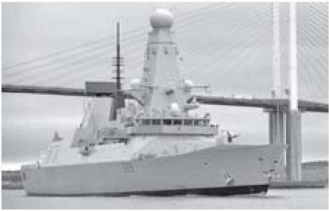
ဖောက်ကလန်ကျွန်းစုအနီးသို့ စေလွှတ်မည့် ဗြိတိန်ရေတပ်၏ ဖျက်သင်္ဘောကို တွေ့ရစဉ်