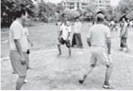
မန္တလေးမြို့၊ အောင်မြေသာစံမြို့နယ် ပြည်ကြီးကျက်သရေအစေ့ရပ်ကွက် အုပ်ချုပ်ရေးမှူးရုံးကြီးမှ အားကစားပြိုင်ပွဲများကျင်းပရာ သက်ကြီးရွယ်အိုများ ကျန်းမာပြိုင်ပွဲနှင့် ရေနှင့် ဖြစ်ပွားရာအားကစား မဟိမ်ကောစေ့အတွက် ရပ်ကွက်နေ သက်ကြီးရွယ်အိုများ ခြင်းလုံးခတ်ယှဉ်ပြိုင်ပွဲကစားကြသည်ကို တွေ့ရစဉ်။ (၃၀၇)

တတိယနေ့ (၁၀)ကျင်းပပြိုင်ပွဲကို မေဖော်ဝါရီ ၄ ရက် နံနက် ၇ နာရီတွင် ယင်းဂေါက်တလန်၌ ဆက်လက်ကျင်းပသွားမည်ဖြစ်ကြောင်း သိရှိရသည်။ (သတင်းစဉ်)