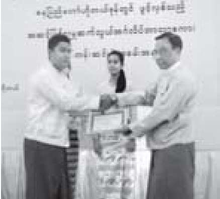
ဟိုတယ်နှင့် ခရီးသွားလာရေးလုပ်ငန်း ဝန်ကြီးဌာန ဒုတိယဝန်ကြီး ဦးဌေးအောင် အဆင့်မြင့်လူမှုဆက်သွယ် အင်္ဂလိပ်ဘာသာ စကားသင်တန်းတွင် ထူးချွန်ဆုရ သင်တန်းသားတစ်ဦးအား သင်တန်းဆင်းလက်မှတ် ပေးအပ်ချီးမြှင့်စဉ်။ (သတင်းစဉ်)

ယင်းနောက် အထွေထွေမန်နေဂျာ ဦးဟန်ထွန်းက သင်တန်းသား သင်တန်းသူများကိုယ်စား သင်တန်းသားကိုယ်စားလှယ် တစ်ဦးအား သင်တန်းဆင်းအောင်လက်မှတ်များပေးအပ်ပြီး သင်တန်းသား သင်တန်းသူများက အင်္ဂလိပ်ဘာသာစကားပြောစွမ်းရည် သရုပ်ပြသခဲ့ကြောင်း သတင်းရရှိသည်။ (သတင်းစဉ်)