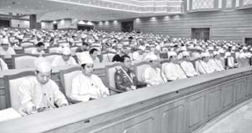
ပထမအကြိမ် ပြည်ထောင်စုလွှတ်တော် တတိယပုံမှန်အစည်းအဝေး စတုတ္ထနေ့ကို တက်ရောက်လာကြသူများအား တွေ့ရစဉ်။ (သတင်းစဉ်)

ပထမအကြိမ် ပြည်ထောင်စုလွှတ်တော် တတိယပုံမှန်အစည်းအဝေး စတုတ္ထနေ့ကို ယနေ့နံနက် ၁၀ နာရီတွင် နေပြည်တော်ရှိ လွှတ်တော်အဆောက်အအုံ ပြည်ထောင်စုလွှတ်တော်ခန်းမ၌ ဆက်လက်ကျင်းပရာ ပြည်ထောင်စုလွှတ်တော်နာယက ဦးခင်အောင်မြင့်၊ ပြည်သူ့လွှတ်တော်ဥက္ကဋ္ဌ သူရဦးရွှေမန်းနှင့် ပြည်ထောင်စုလွှတ်တော်ကိုယ်စားလှယ် (၅၆၆) ဦးတို့ တက်ရောက်ကြသည်။