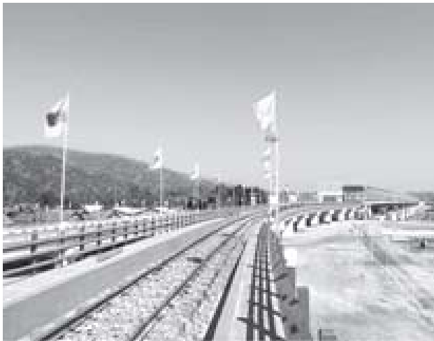
သတင်းမှတ်စု - မောင်ငြိမ်းအေး