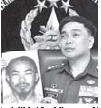
ဖိလစ်ပိုင်စစ်ဘက်ပြောရေးဆိုခွင့်ရှိသူက သေဆုံးသွားပြီဖြစ်သည့် အကြမ်းဖက်သမား မာဝန်၏ဓာတ်ပုံကိုဖြည့် ရှင်းလင်းပြောကြားနေစဉ်

မနီလာ ဖေဖော်ဝါရီ ၃ အရှေ့တောင်အာရှတွင် အလိုရှိဆုံးအကြမ်းဖက်သမားတစ်ဦးကို ထိပ်တန်းစစ်သေနာကျွန်ုပ်တို့နှင့်အတူ ဖေဖော်ဝါရီ ၂ ရက်နေ့၌ အသေဖမ်းဆီးရမိကြောင်း ဖိလစ်ပိုင်စစ်ဘက်က ပြောကြားသည်။ ဖိလစ်ပိုင်နိုင်ငံတောင်ပိုင်း ကျွန်းတစ်ကျွန်းပေါ်ရှိ စစ်သေနာကျွန်ုပ်တို့တစ်ဦးကို ပစ်ခတ်သား၍ နံနက်အရုဏ်တိုက်ခိုက်မှု၌ ဝင်ရောက်စားနပ်ရိက္ခာ အယ်လ်ဒိုင်းအိမ်နှင့် ဆက်သွယ်မှုရှိသည့် ဂျာမားအစုလက်အကြမ်းဖက်ကျွန်ုပ်တို့ခေါင်းဆောင် မလေးရှားလူမျိုး မာဝန်ဟုလည်းခေါ်သော ဇလိက်ဖိလစ်ပိုင် သေဆုံးသွားပြီဖြစ်ကြောင်း စစ်ဘက်ပြောရေးဆိုခွင့်ရှိသူ ဝိုလ်ဖျူဖျူ မာစီလိုဘာဂီ(စ်)က ပြောသည်။ အမေရိကန်ပြည်ထောင်စုက မာဝန်ကိုဖမ်းမိလျှင် ဆူဇေးခေါ် လာ ဝါးသန်းဆွဲမြင်မည်ဟု ကမ်းလှမ်းထားခဲ့သည်။