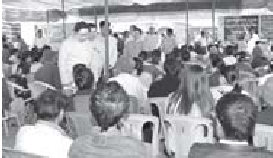
နေပြည်တော် ဈေးသိရိမြို့နယ်၌ အထူးကုဆရာဝန်ကြီးများ ကျန်းမာရေးကွင်းဆင်းကုသပညာပေးနေစဉ်။

ကြည့်ရှုအားပေးကြသည်။ (ဝဲဒံ) ဈေးသိရိမြို့နယ်၌ အထူးကုဆရာဝန်ကြီးများအဖွဲ့ ၁၀ ဖွဲ့နှင့် တိုင်ရင်းဆေးကုသရေးအဖွဲ့တို့သည် ဝေဟင်မြို့နယ်အား နေပြည်တော်ကောင်စီ၏အစီအစဉ်ဖြင့် ဆေးဝါးကုသပေးခြင်း၊ မျက်စိဝေဒနာရှင်များအား အခမဲ့ခွဲစိတ်ကုသပေးပြီး မျက်မှန်များတပ်ဆင်ပေးခြင်းနှင့် အရေးပေါ်လူနာများအား နေပြည်တော်ခုတင် (၁၀၀၀) ဆံ့ပြည်သူ့ဆေးရုံကြီးနှင့် ဇီဝတဓါနုခုတင်(၁၀၀၀)ဆေးရုံတို့သို့ ဆက်လက်ပို့ဆောင်ပေးခြင်းတို့ကို ဆောင်ရွက်ပေးခဲ့သည်။ အဆိုပါအထူးကုဆရာဝန်ကြီးများအဖွဲ့သည် နေပြည်တော်ကောင်စီ၏စီစဉ်မှုဖြင့် ကျွန်ုပ်မြို့နယ် ခုနစ်မြို့နယ်သို့ ဆက်လက်ကွင်းဆင်းကုသပေးမည်ဖြစ်ကြောင်း သိရှိရသည်။ (သတင်းစဉ်)